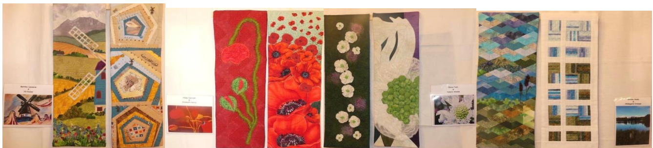
Original Challenge Idee und Fotos von Lippetal-Quilter, Deutschland sowie Gone to Pieces, England

Margueritha Frank Gärtnergasse 2/5 1030 Wien margueritha@patchworkgilde.at